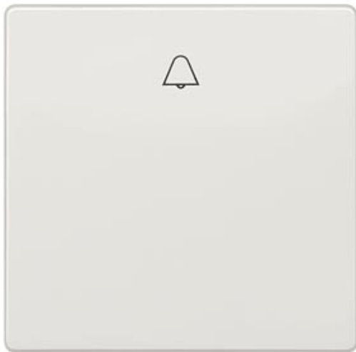
DELTA STYLE, TITANWEISS WIPPE MIT SYMBOL GLOCKE FUER TASTER, 68X68MM