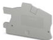
Abschlussdeckel, Länge: 66 mm, Breite: 2,2 mm, Höhe: 42,3 mm, Farbe: grau