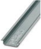
Tragschiene 35 mm (NS 35)

Tragschiene - NS 35/ 7,5 WH UNPERF 2000MM - 1204122