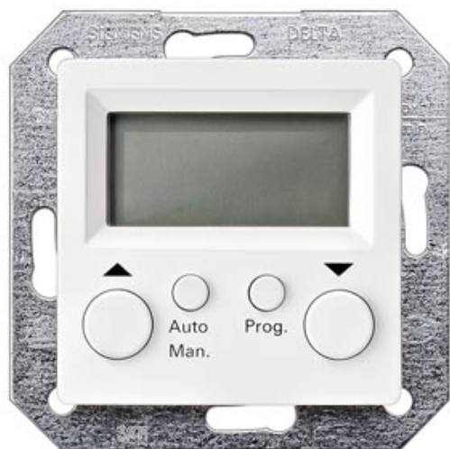
I-SYSTEM, TITANWEISS JALOUSIESTEuerung KOMPLETTGERÄT 55X55MM