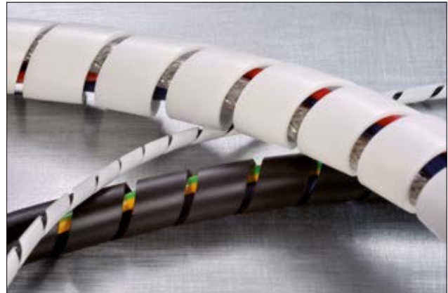
Spiralschlauch SBPEFR ist in mehreren Größen in Schwarz und Weiß erhältlich.