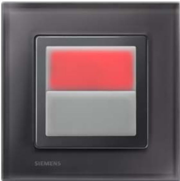
DELTA M-SYSTEM LICHTSIGNAL 1-FACH 1W 90-240V LICHTFARBE ROT