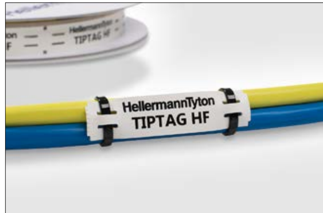
TIPTAG HF – bedruckbare Kennzeichnungsschilder.