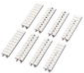
Zackband, Streifen, weiß, beschriftet, längs bedruckt: fortlaufende Zahlen 1-10, 11-20 usw. bis 491-500, Montageart: Verrasten in hoher Schildchennut, für Klemmenbreite: 5,2 mm, Schriftfeldgröße: 5,15 x 10,5 mm

Zackband - ZB 5,LGS:FORTL.ZAHLEN - 1050017