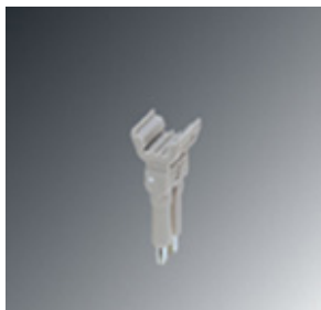
Steckbrücke, Rastermaß: 5,2 mm, Polzahl: 2, Farbe: rot

Bitte beachten Sie, dass die hier angegebenen Daten dem Online-Katalog entnommen sind. Die vollständigen Informationen und Daten entnehmen Sie bitte der Anwenderdokumentation. Es gelten die Allgemeinen Nutzungsbedingungen für Internet-Downloads. ( http://phoenixcontact.de/download )