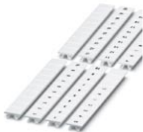
Zackband, 10-teilig, längs bedruckt mit den fortlaufenden Zahlen: 331 ... 340, weiß, Breite: 8 mm

Bitte beachten Sie, dass die hier angegebenen Daten dem Online-Katalog entnommen sind. Die vollständigen Informationen und Daten entnehmen Sie bitte der Anwenderdokumentation. Es gelten die Allgemeinen Nutzungsbedingungen für Internet-Downloads. ( http://phoenixcontact.de/download )