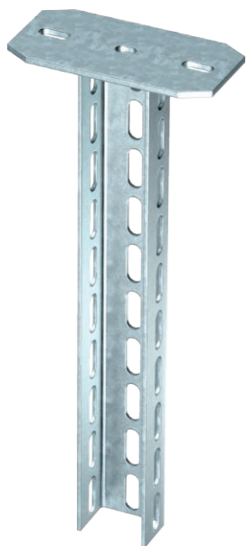
Hängestiel (U-Profil) in der Abmessung 70 x 50 mm mit angeschweißter Kopfplatte.