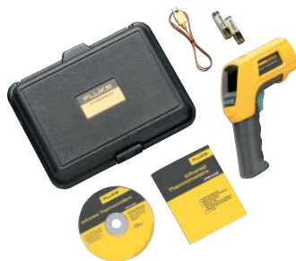
Fluke 566 und enthaltenes Zubehör

Anzeige aller Messdetails auf einen Blick