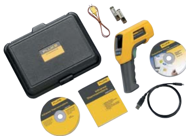
Fluke 568 und enthaltenes Zubehör